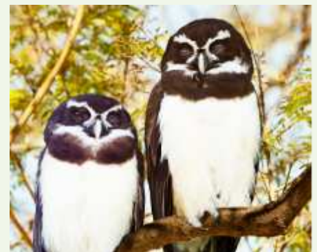
Der Brillenkauz besticht durch sein markantes Gefieder.

Auf der ehemaligen Alpaka-Anlage ist nun ein Mini-Shetlandpony zu Hause. Großer Beliebtheit erfreut sich weiterhin die große und begehbare Wellensittich-Voliere. Der Bestand der Wellensittiche hat sich erheblich erhöht. In der Vergangenheit sind die kleinen bunten Vögel sehr zutraulich geworden und fressen den Besuchern aus der Hand. Sie können mit den Hirsekolben, die es an der Eintrittskasse käuflich zu erwerben gibt, gefüttert werden. Es lohnt sich also, wieder einmal einen Besuch im Tierpark Ueckermünde zu unternehmen. Übrigens können Jahreskarten noch bis 30.03.25 zum Aktionspreis erworben werden. DS