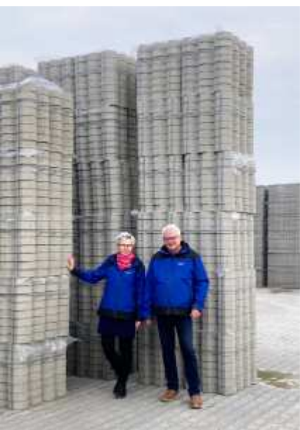
Pflastersteine, wohin das Auge blickt. Je nach Kundenwunsch in verschiedenen Farben.