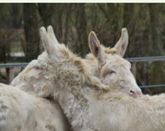
Die Barockesel sind nur einige der neuen Bewohner im Ueckermünder Tierpark.

Für viele Freunde und Unterstützer des Tierparks ist es sozusagen „Ehrensache“, das Team beim Frühjahrs- bzw. Herbstputz zu unterstützen. Sie können sich für ihre persönliche Planung schon den 22. März vormerken. Um 09:30 Uhr ist Treffpunkt am Eingang des Haffzoos für die Putzaktion. Das restliche Laub vom vergangenen Herbst soll beseitigt werden und dem Winterschmutz wird zu Leibe gerückt. Außerdem steht auf dem Plan, weitere Bäume und Frühjahrsblüher zu pflanzen. Die fleißigen Helfer werden mit einem warmen Mittagessen und Getränken versorgt. Wer sich an der Aktion beteiligen möchte, sollte sich bitte bis zum 19. März unter der Telefonnummer 039771 54940 anmelden und für den Einsatz seine Gartengeräte und Handschuhe mitbringen.