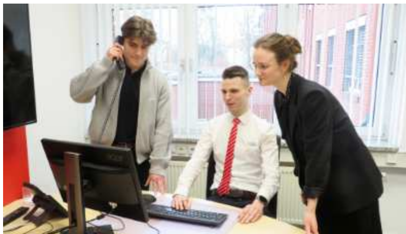
Die frisch gebackenen Bankkaufleute freuen sich über die sehr gute Arbeitsbedingungen in den Filialen, in denen sie ab sofort tätig sein werden.