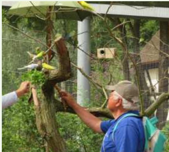
Die Wellensittiche in der großen begehbaren Voliere sind mittlerweile sehr zahm und können von den Besuchern mit Hirsekolben gefüttert werden.