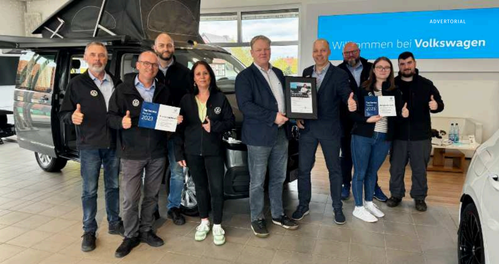
Im Jahr 2023 wurde Dein Autozentrum Pasewalk GmbH als Top-Servicepartner im Bereich VW-Nutzfahrzeuge ausgezeichnet.