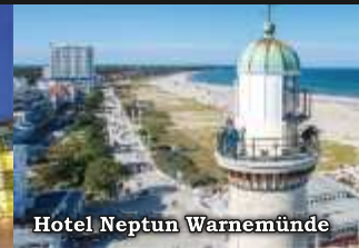
Hotel Neptun Warnemünde