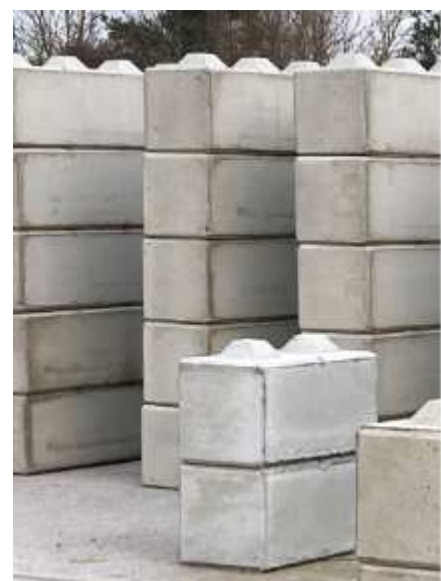
Die beliebten Stapelsteine erhalten noch eine Struktur.

Dass die Weiterentwicklung der Produkte und des Unternehmens von Erfolg gekrönt ist, zeigt eindrucksvoll die 120-jährige Geschichte. Das Jubiläum in diesem Jahr ist ein willkommener Anlass, im Sommer gemeinsam mit Kunden, Geschäftspartnern und den Mitarbeitern zu feiern. DS